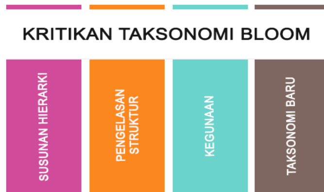
Rajah 1: Kritikan Terhadap Taksonomi Bloom

Kritikan terhadap Taksonomi Bloom dibahagikan kepada empat tema daripada 30 pandangan kebanyakan ahli akademik iaitu, (1) susunan hierarki, (2) pengelasan struktur, (3) kegunaan dan (4) keperluan kepada taksonomi yang baru. Dapatan kajian dibincangkan seperti di bawah: