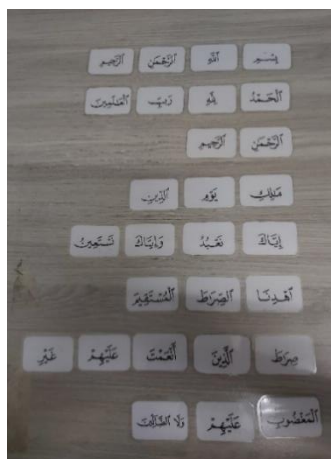
Rajah 1.1: Fasa Kaedah Tahfiz Akhyar

Murid menyusun pecahan kalimah surah al-Fatihah