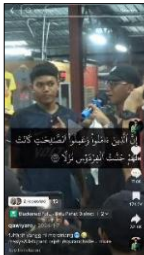
Rajah 1: Pengengaruh Qawiyaro membuat cabaran hafazan al-Quran secara spontan menerusi kempen kelolaannya di TikTok; “Sambung Ayat Quran Dapat RM100.”