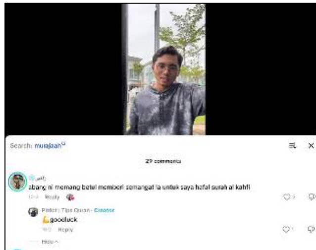
Rajah 2: Salah satu aspek yang menarik tentang akaun @pirdot.official adalah keterlibatan yang tinggi dengan pengikutnya. Beliau sering menjawab soalan yang diajukan oleh pengikut di ruang komen dan mengadakan sesi langsung untuk berinteraksi bersama pengikutnya di TikTok.

komitmen tinggi seperti tahfiz. Solusi ini turut merangkumi pemilihan waktu afdhal seperti sebelum Subuh dan penciptaan persekitaran pembelajaran yang bebas gangguan (Pirdot, 2020d). Pendidik pula disarankan meningkatkan kredibiliti dengan menjaga adab semasa sesi tasmik (Syaurah, 2025o). Akhir sekali, masyarakat digesa memanfaatkan platform digital sebagai medan dakwah yang mengangkat kehebatan al-Quran (Qawiyaro, 2025e; 2024b). Hal ini diperkukuhkan oleh Hamid et al. (2024) yang melihat peranan pengengaruh digital sebagai ejen perubahan ( agent of change ) yang mampu menstruktur semula ekosistem pendidikan Islam secara tidak formal melalui naratif yang lebih inklusif dan mudah diakses.