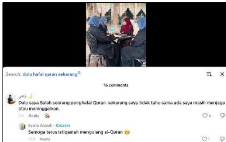
Rajah 3: Pemilik akaun @iwanaaisyah sering turun padang untuk menjalankan program perkongsian ilmu hafazan bersama pelajar yang berpendidikan tahfiz al-Quran.