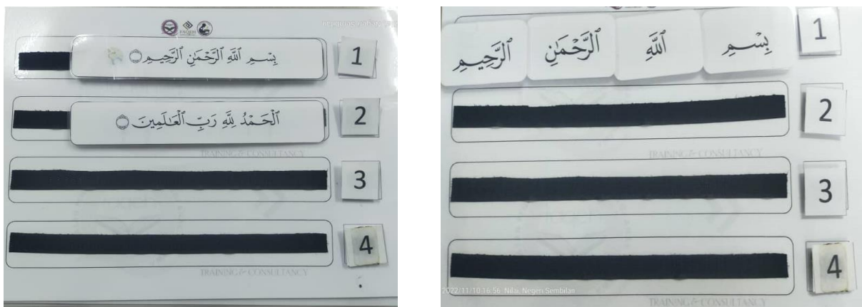
Rajah 3: Susunan bernombor pecahan ayat dan kalimah

Setelah murid dapat menguasai peringkat pertama melalui padanan pecahan ayat yang sama, murid akan berganjak kepada peringkat seterusnya iaitu peringkat kedua susunan bernombor. Pada peringkat kedua ini, murid diminta untuk menyusun pecahan ayat berdasarkan nombor ayat yang diberikan. Sekiranya murid boleh menyusun pecahan ayat mengikut nombor ayat yang betul, ini telah membuktikan murid telah mengenal kedudukan ayat yang telah dihafaz.