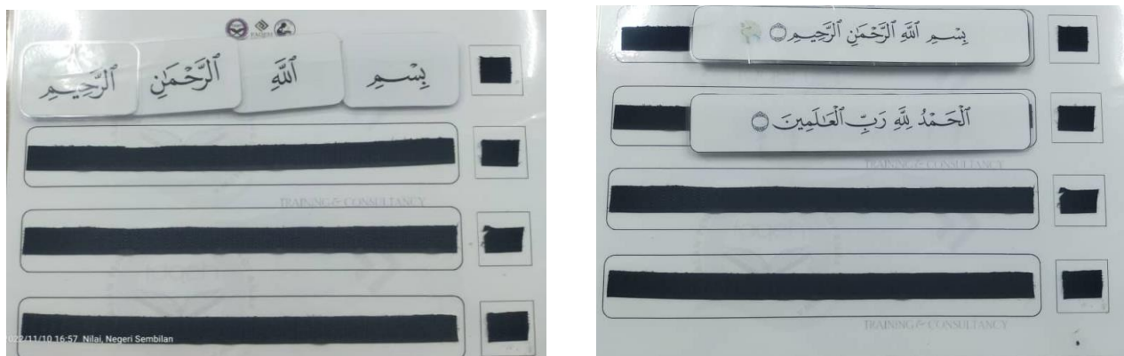
Rajah 4: Susunan tanpa bernombor pecahan ayat dan kalimah

Peringkat ketiga merupakan peringkat terakhir bagi aktiviti susunan pecahan ayat dan ia lebih sukar berbanding peringkat pertama dan kedua. Pada peringkat ini, murid akan menyusun susunan pecahan ayat tanpa bantuan nombor. Peringkat ini lebih menguji kemampuan murid untuk menghafaz kedudukan pecahan ayat yang telah dihafaz. Proses pengulangan dalam setiap peringkat diterapkan kepada murid supaya boleh menghafaz setiap ayat.