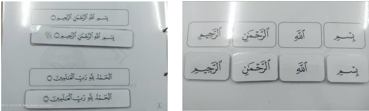
Rajah 2: Padanan pecahan ayat dan kalimah

Pada peringkat permulaan ini murid akan diperkenalkan pecahan ayat berpandukan surah hafazan yang telah diperdengarkan pada fasa pertama. Seterusnya, murid diminta untuk meletakkan potongan ayat yang sama secara berulang kali.